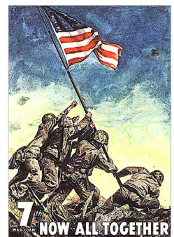
»Raising the Flag on Iwojima« (1945)

Febr. Rückzug der Japaner aus Burma US-Streitkräfte landen auf Okinawa und Iwojima (Japan) - äußerst verlustreiche Kämpfe Aug. 8.8. Atombombenangriff auf Hiroshima 9.8. Atombombenangriff auf Nagasaki Die Sowjetunion erklärt Japan den Krieg; Besetzung der nördl. Sachalin-Insel, der Kurilen und Koreas Sept. 2.9. Japan kapituliert