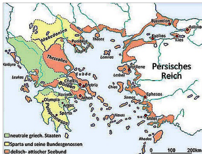
Ἀθηναῖοι καὶ οἱ σύμμαχοι ( Die Athener und ihre Bundesgenossen ): Griechenland und die Ägäis am Vorabend des Peloponnesischen Krieges (431 v. Chr.)

In: Herfried Münkler, Imperien. Die Logik der Weltherrschaft - vom alten Rom bis zu den Vereinigten Staaten , Berlin 2016 (4. Aufl.), S. 79ff.