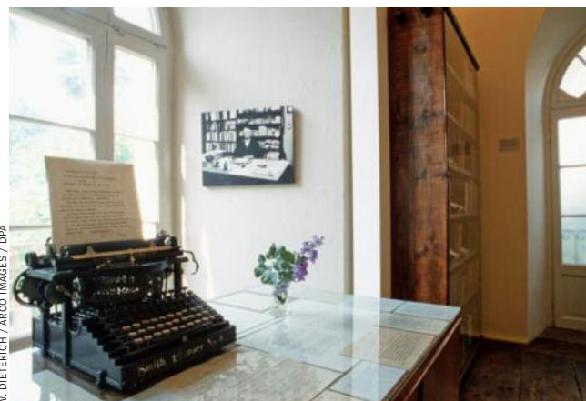
Hesse-Museum in Montagnola: Eine Schildkröte namens Knulp

Doch sie, so möchte man hoffen, verstören weiter.