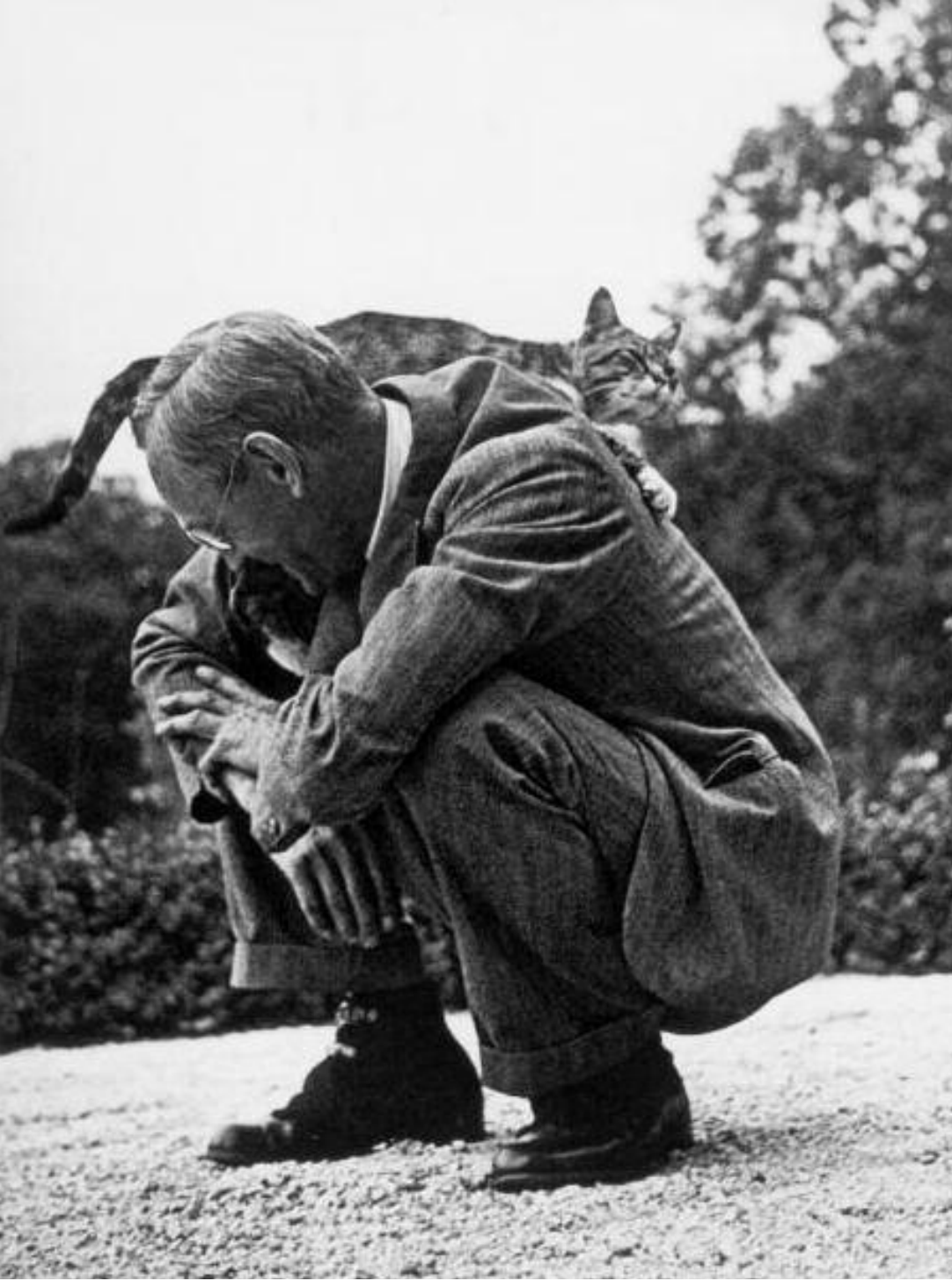
Katzenfreund Hesse in Montagnola 1955: Inzwischen dichterisch verstummt

Häutung: Der Umzug ins Tessin bringt einen Schaffens- und Farbrausch, das Tessin-Zimmer ist das hellste im Hesse-Museum in Calw, ein Strohhut, ein Spazierstock in der großen Schauvitrine, Hesse ist angekommen, vorerst, hier werden die Hauptwerke entstehen, „Siddhartha“, „Der Steppenwolf“, „Narziss und Goldmund“, „Das Glasperlenspiel“.