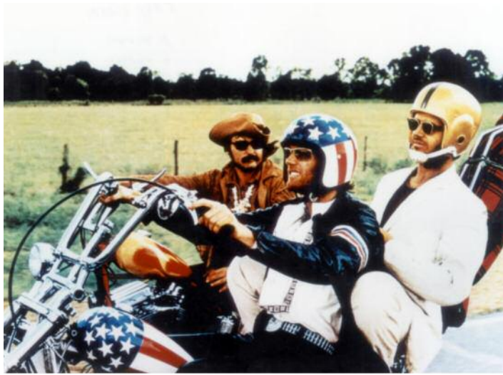
Kultfilm „Easy Rider“*: Revolution now