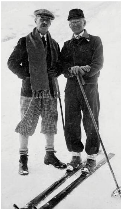
Freunde Mann, Hesse bei St. Moritz 1932 „Dankbares Entzücken“

Schon vorher war eine neue beglückende Freundschaft in sein Leben getreten: Hugo Ball, der Dada-Künstler und Schriftsteller und Cabaret-Voltaire-Häuptling, war mit seiner Frau Emmy Hennings in die Nähe gezogen.