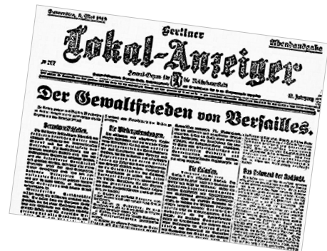
Schlagzeile in der Berliner Presse vom 30. Juni 1919

Das linksrheinische Gebiet mit den Brückenköpfen Köln, Koblenz und Mainz stand unter alliierter Besatzung , die bei deutschem Wohlverhalten in drei Etappen (nach 5, 10, 15 Jahren) abgezogen werden sollte; rechts des Rheins wurde eine 50 km breite entmilitarisierte Zone errichtet. Teil V des Vertrags sah eine drastische Beschränkung der deutschen Militärmacht vor. Die Wehrpflicht wurde abgeschafft, das Landheer auf 100 000, die Marine auf 15 000 Berufssoldaten begrenzt, die Bewaffnung stark reduziert. In der Frage der Reparationen , mit denen zivile Schäden abgegolten werden sollten, setzte der Vertrag überaus harte Liefer- und Zahlungsverpflichtungen als Abschlag auf die noch offene Gesamtsumme fest.